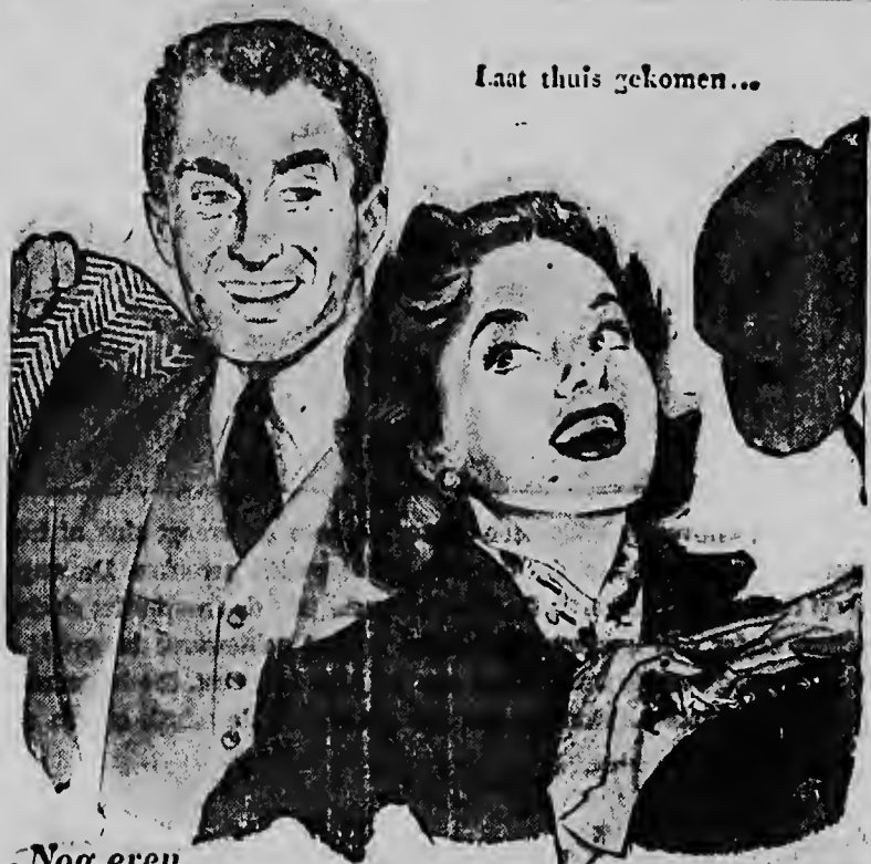
Laat thuis gekomen...

van boven 18 jaar met verkopersambitie gezocht bij een vooraanstaand agentskants voor vaste betrekking en serieuze opleiding als verkoper en met prima voornemens. Sollicitaties, alleen eigenhandig geschreven, vermeldende volledige naam, adres, genoten opleiding, talenkennis en andere bijzonderheden te richten onder letter A. S. aan het bureau van dit blad.